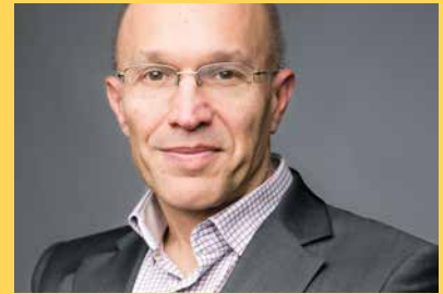
Christian CHAVAGNEUX