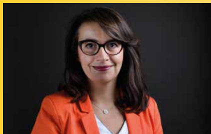
Cécile DUFLOT