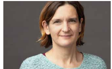
Esther DUFLO