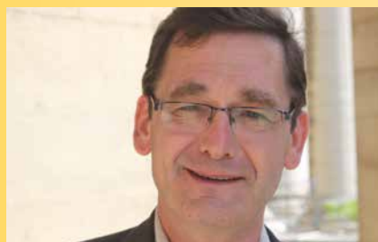
Christian de PERTHUIS