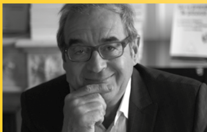
Pascal PICQ