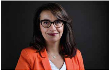
Cécile DUFLOT © Maxime-Riché Oxfam-France