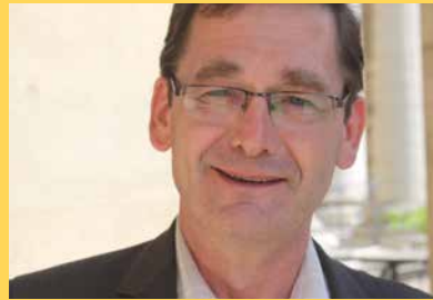
Christian de PERTHUIS