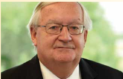
Patrick ARTUS