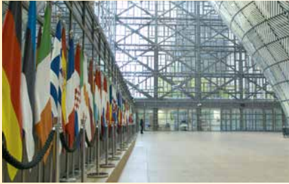
L'Europe et ses fantômes