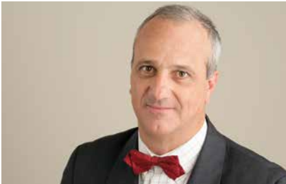
Jean-Marc VITTORI