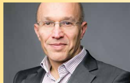
Christian CHAVAGNEUX