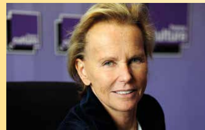
Christine OCKRENT