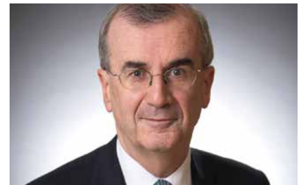
François VILLEROY DE GALHAU