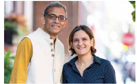
Esther DUFLO et Abhijit V. BANERJEE