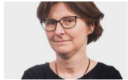
Agnès BENASSY-QUÉRÉ