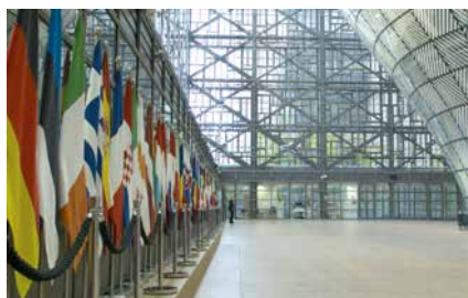
L'Europe et ses fantômes